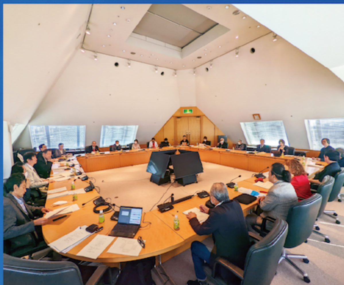
・JASRAC会議室で開催された定時社員総会の模様

6月10日、FCAは2022年度の第1回理事会と定時社員総会を開催しました。理事会は音楽作家団体の会員から選ばれた22名の理事によって構成され、FCAが行う活動について意思決定する機関です。理事会では、新たな音楽作家団体の入会や定時社員総会に付議する議案等について審議しました。